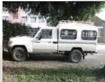
El nou Land Cruiser