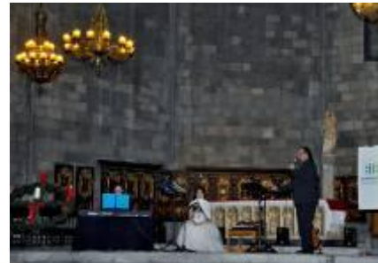
Actuació de Black&White Spirituals Trio