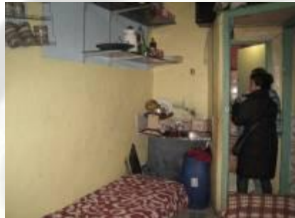
Visita social a un domicili