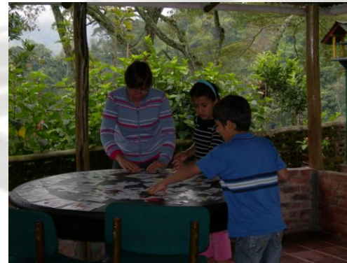
En pleno aprendizaje

Entre semana, al llegar los niños les leía un cuento, y ellos lo dibujaban. Luego, con rompecabezas y fichas de palabras ellos empezaron a reconocer vocablos, y a repetirlos. Al verlos ya reconocían la palabra y la leían. Para aprender los números daban vueltas alrededor del murito del kiosco (porche de la casa) y en cuanto se equivocaban volvían a empezar. Luego seguimos con los números pares y los impares. Al terminar preparaba las onces (merienda), entre tanto ellos jugaban y recuperaban su alegría.