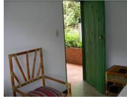
Vista interior unitat de silenci