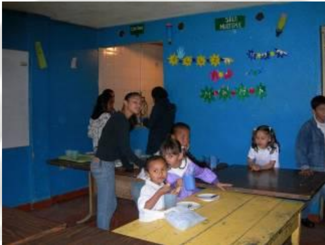
Estona de berenar abans del reforç escolar