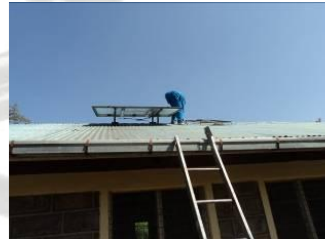
Instal·lació de les plaques solars a l'escola