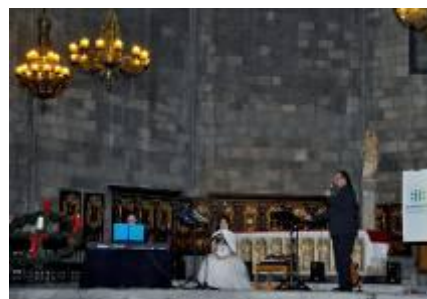
Actuación de Black&White Spirituals Trio