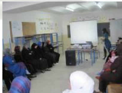
Curso de formación para madres