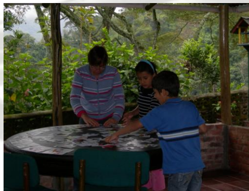
En pleno aprendizaje

Entre semana, al llegar los niños les leía un cuento, y ellos lo dibujaban. Luego, con rompecabezas y fichas de palabras ellos empezaron a reconocer vocablos, y a repetirlos. Al verlos ya reconocían la palabra y la leían. Para aprender los números daban vueltas alrededor del murito del kiosco (porche de la casa) y en cuanto se equivocaban volvían a empezar. Luego seguimos con los números pares y los impares. Al terminar preparaba las onces (merienda), entre tanto ellos jugaban y recuperaban su alegría.