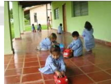
Momento de recreo