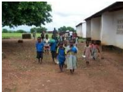
Hora del desayuno de los pequeños